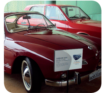
Alguns dos veículos antigos expostos durante o Festival.