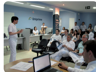
Quadro cooperativo presente na AGE realizada na Sede em Cascavel, no dia 17 de novembro.

Duas das alterações aprovadas referem-se aos artigos 39 e 49 do Estatuto Social. Uma delas atende a indicação do Banco Central e estabelece regras para a posse da Diretoria e do Conselho Fiscal. Outra alteração estabelece a possibilidade de associação dos demais profissionais do Grupo 2 da Classificação Brasileira de Ocupações do Ministério do Trabalho e Emprego, onde se inserem os médicos, odontólogos e demais profissionais da área da saúde. A associação de outros novos profissionais somente ocorre a partir de convite realizado formalmente pelo Quadro Associativo e Diretoria e aprovados pelo Conselho de Administração.