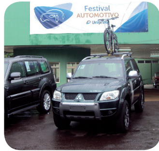
Colaboradores e Diretoria da Uniprime Oeste do Paraná e alguns dos veículos à venda durante o Festival.